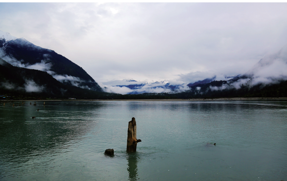
第七天的景观之一：古乡湖