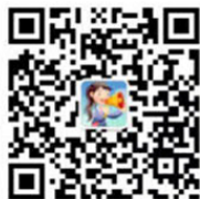
中国三峡出版传媒