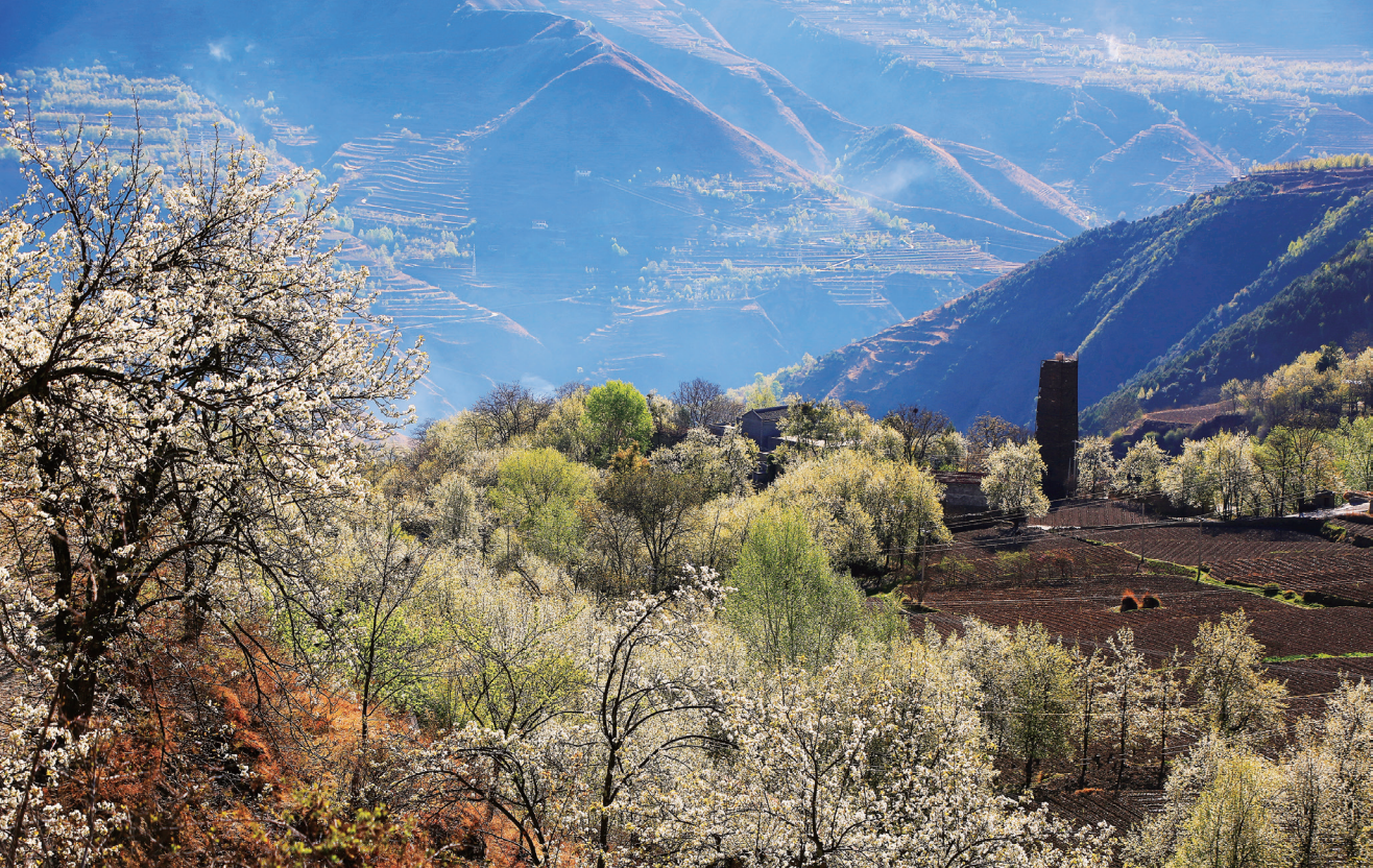
第二天的景观之一：金川梨花