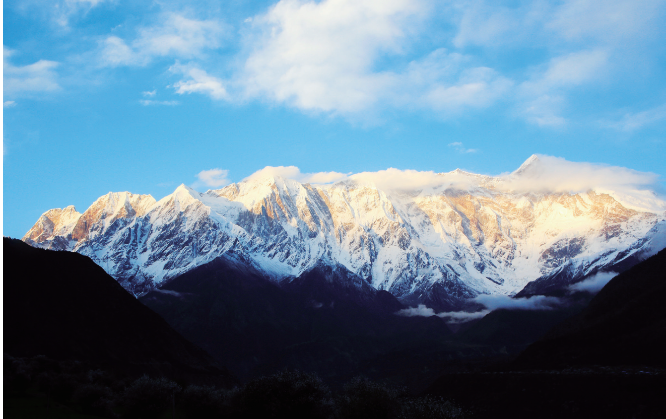
第八天的景观之一：南迦巴瓦峰