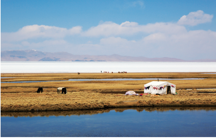
第十一天的景观之一：纳木错