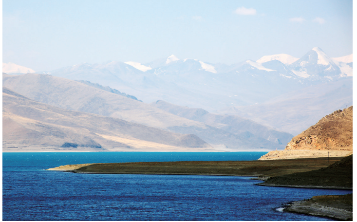
第十二天的景观之一：羊卓雍措