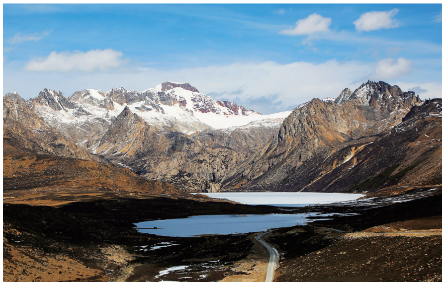
第四天的景观之一：海子山姐妹湖