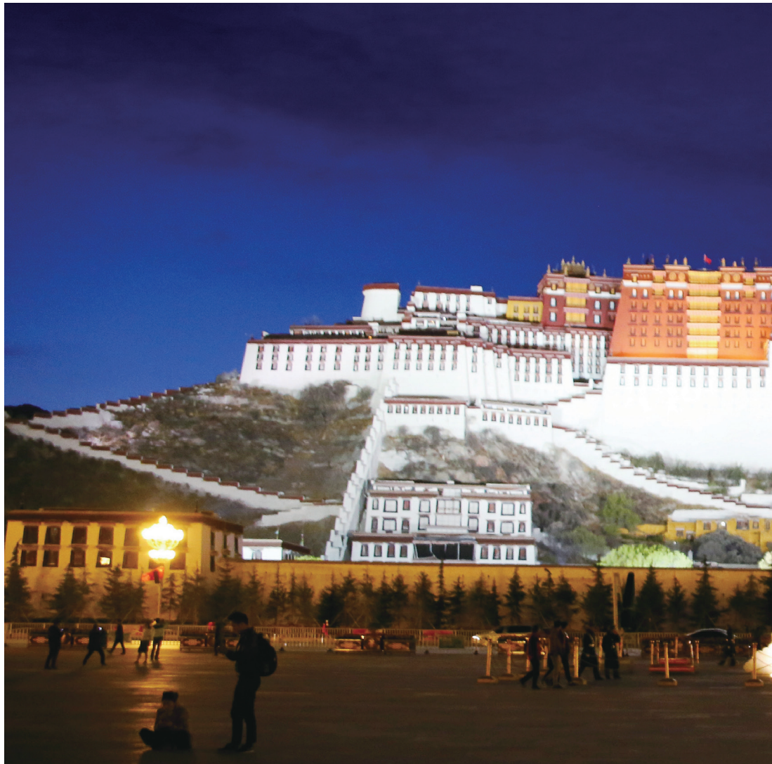
第十天的景观之一：布达拉宫夜景