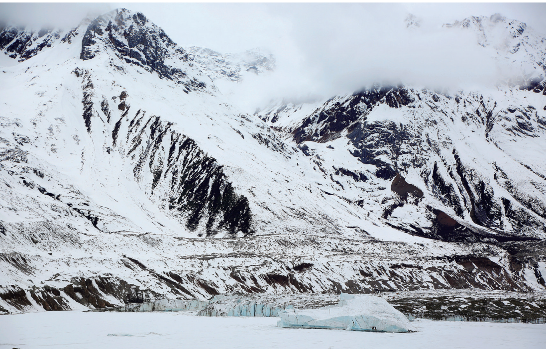
第六天的景观之一：来古冰川