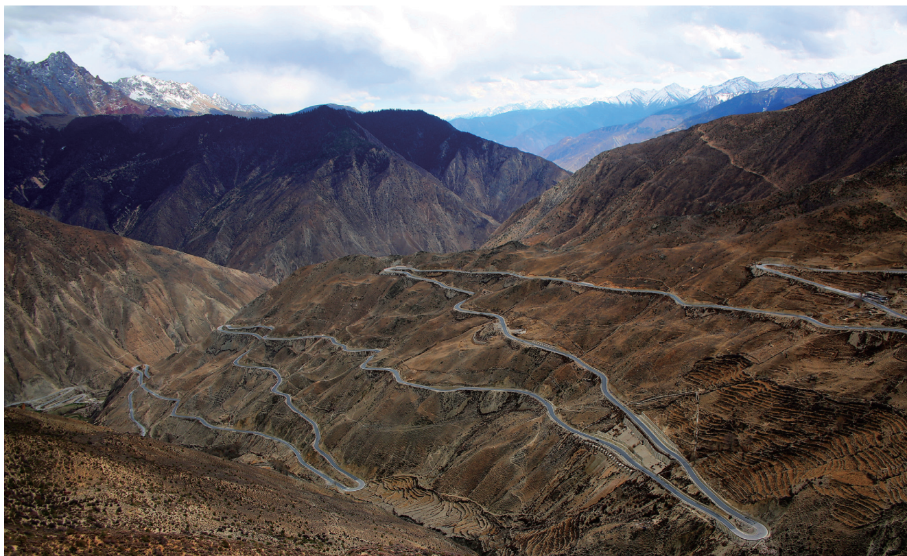
第五天的景观之一：天路72道拐