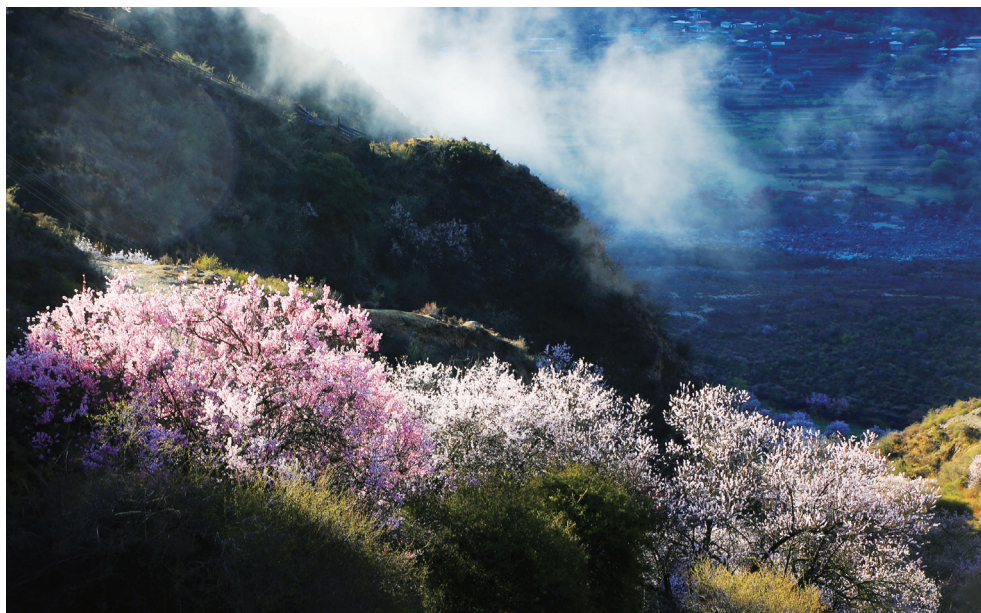
第九天的景观之一：雅鲁藏布大峡谷中的桃花