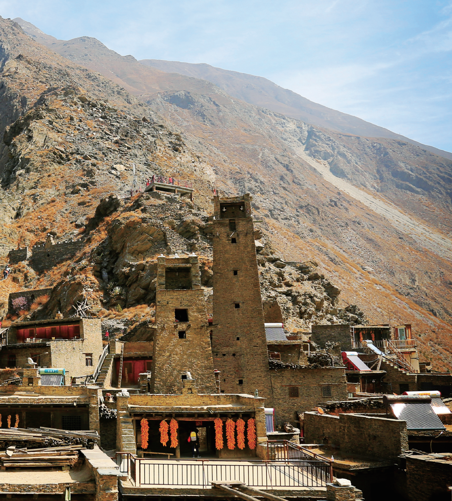
第一天的景观之一：桃坪羌寨