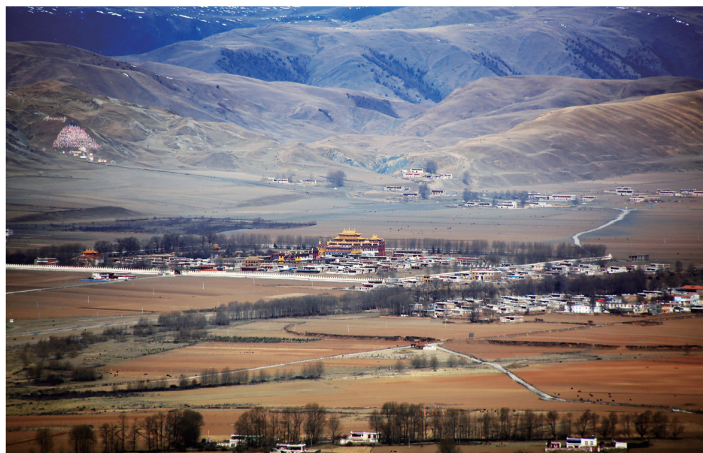
第三天的景观之一：莲花坝子