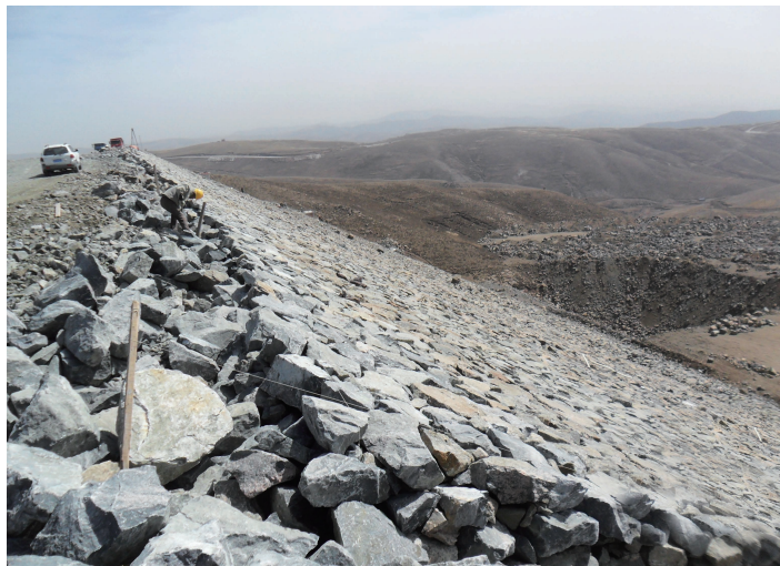
上水库堆石坝施工