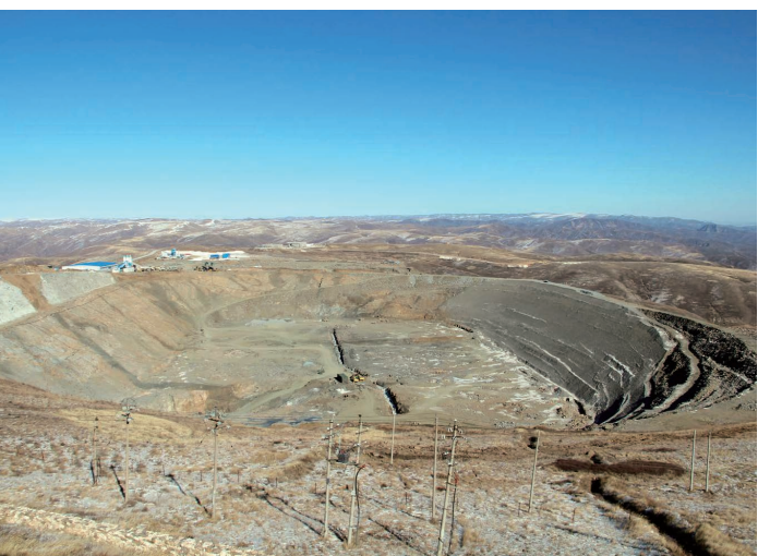
上水库库盆开挖面貌