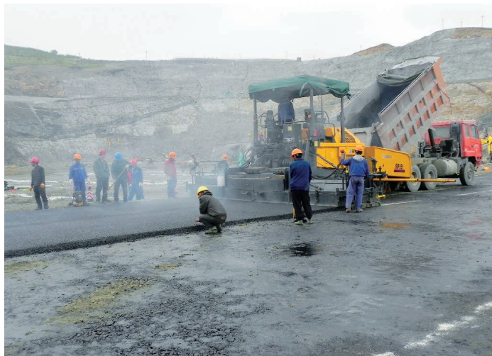
库底沥青混凝土摊铺